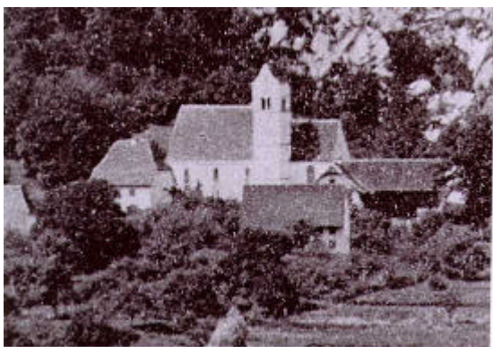
Alte Kirche, Pfarrhaus und Schulhaus um 1880

Fotos zeigen den damaligen Mittelpunkt unseres Dorfes um die Wende zum 20. Jahrhundert.