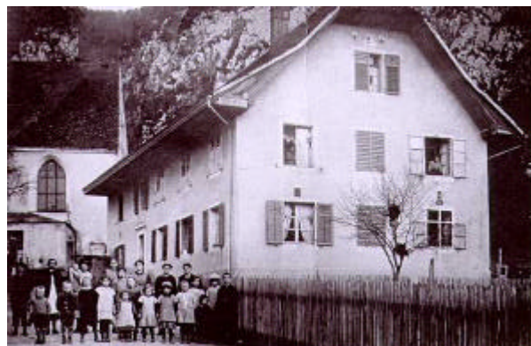
Schulbetrieb neben der Friedhofkirche ca. 1890

In Jahre 1895 wurde bekanntlich das Inselischulhaus gebaut.